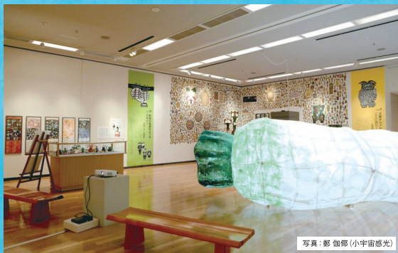
令和5年度『みんなのキンビ』プロジェクト第1弾「大根ヒネーション展」の様子

※『キンビコミュニケーター』は、秋田にくらす人やテーマと結びつきながら、アートを通して生まれるコミュニケーションを大切に、人と人、人と地域をつなぐ存在です。令和6年度は高校生から70代までの23名が、「誰もが美術館で楽しむためには」をテーマに熟議を重ね、本展ワークショップを企画しました。