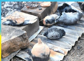
様々な体験と交流の場「キンビ美術部」