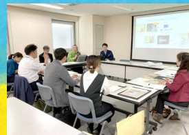
「不忍池園」鑑賞支援ツールの検討