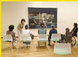
「高齢者×アート×MUSEUM」をテーマとした絵画鑑賞プログラム